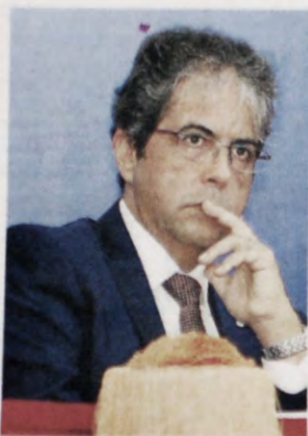
Bosch es mostrà també seriós.

Aquest és el segon any que Bosch assisteix com a conseller a