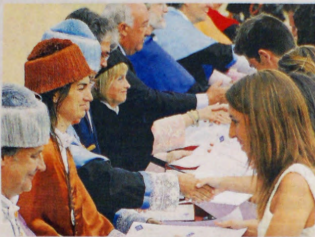
Els llaços també es van veure a la taula presidencial.