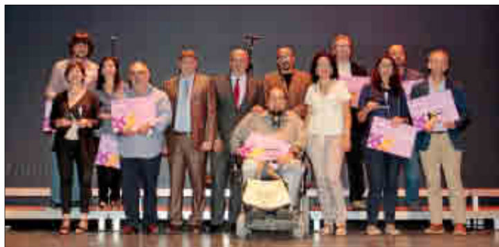
Los premiados ayer en el Teatre Principal. JORDI AVELLÀ

Sus 20 años acompañando a personas privadas de libertad en su piso de acogida le valieron a la Asociación Pastoral Penitenciaria el Premio a la Solidaridad en la categoría de Servicios Sociales. Un ámbito en el que también se quiso premiar el reporta-